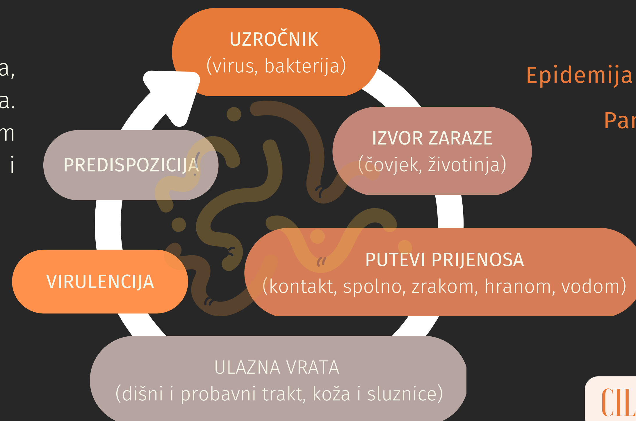
Slika 1. Epidemiološki ili Vogralikov lanac

Epidemija je pojava određene bolesti na ograničenom prostoru, a karakterizira ju veći broj oboljelih.