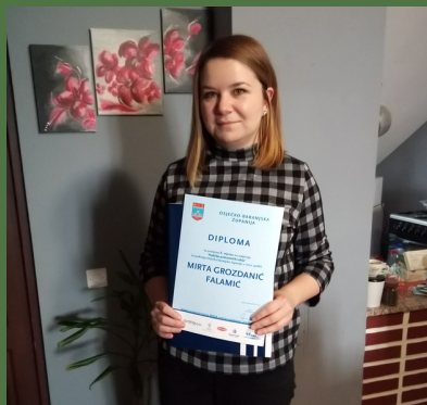
NAJBOLJA PODUZETNIČKA IDEJA 2020. OBŽ

Rad s glinom povoljno utječe na psihi, jer ima umirujuće djelovanje, pa je idealna terapija protiv stresa koji je danas sve više prisutan. Vježbanje dlanova, šaka, zapešća i ruku, podupire kretanje i spretnost zglobova dok se glina oblikuje vrlo je korisna onima koji su skloni artritisu ali i ručicama u razvoju. Lončarstvo je važno za samoizražavanje. To je dobar način za učenje novih tehnika, učenju i prakticiranju produktivnog hobija, ali i poboljšanje kvalitete života. Lončarstvo će postati prepoznatljiva poveznica međugeneracijske suradnje u lokalnoj zajednici. Lončarstvom se u donjomiholjačkom kraju ne bavi nitko. Najbliži lončar koji drži edukacije živi i radi u Baranji. Poduzetnička ideja ima edukacijske i proizvodne elemente specifične za rad učeničke zadruge.