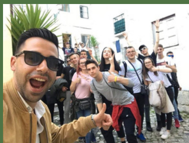
Get ready for EU labour Market Erasmus+ stručna praksa u Portugalu 2020.