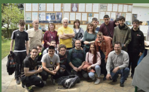
K1 posjet škole iz Katalonije Donjem Miholjcu, 2019.

SUVREMENA ŠKOLA PO MJERI SVAKOG UČENIKA ŠKOLA PROŠLOSTI, ŠKOLA BUDUĆNOSTI