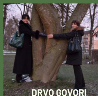
DRVO GOVORI prijateljstvo sa školom u Novom Sadu i posjet Donjem Miholjcu