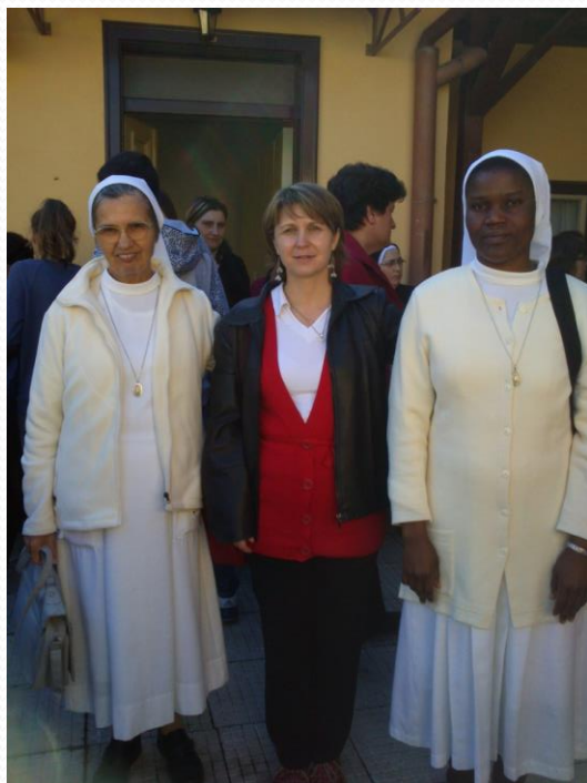
MARIJINE SESTRE- Marijini obroci